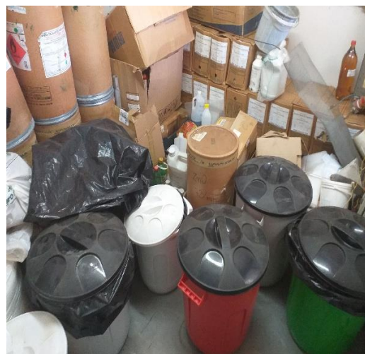
Descarte de resíduos e outros materiais no prédio da UPEQ.