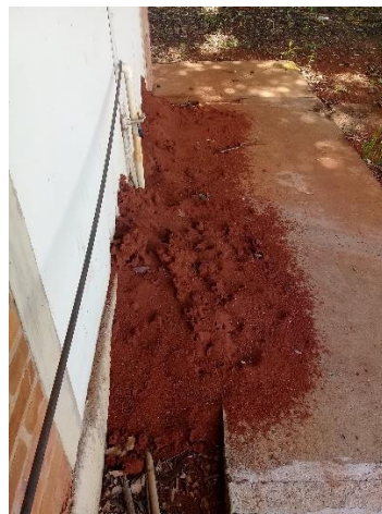
Problemas com formigueiros e cupinzeiros na área externa da UPEQ.

Em 2019 , foi instalado na UPEQ a conexão de internet banda larga , do tipo fibra óptica de 100 Mbps , que resultou em uma melhora significativa na qualidade de conexão com a internet , uma vez que a conexão anterior era de tecnologia ADSL de apenas 10 Mbps.