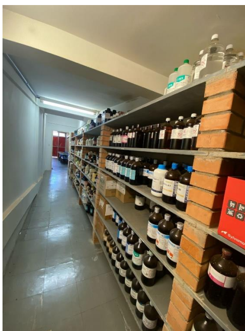
Almoxarifado da FEQUI - 1K 110.

Registra-se ainda no Bloco 1K mais duas alterações, as reformas realizadas no almoxarifado (sala 1K 110) , construção de bancadas de tijolinho à vista e pedras de ardósia , e a reforma da sala de convivência (copinha) , sala 1K 112, conforme imagens a seguir: