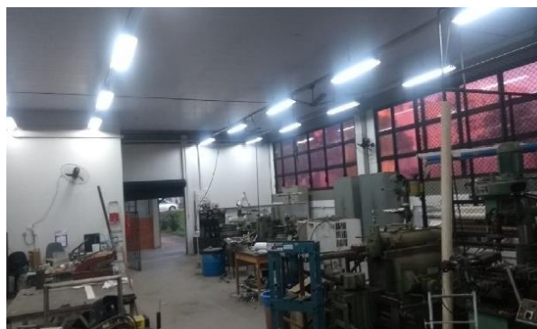
Pintura externa e interna da Oficina Mecânica da FEQU.

Na oficina mecânica foi instalado um segundo compressor , de linha branca (Compressor SCHULZ, modelo CSW 60, isento de óleo), que passou a alimentar o laboratório multiusuário e os laboratórios de pesquisa dos blocos 1Z-A e 1Z-B . O compressor preto (Compressor SCHULZ, modelo MSV 30 Industrial) ficou destinado apenas para uso da oficina e stand by para os laboratórios de pesquisa .