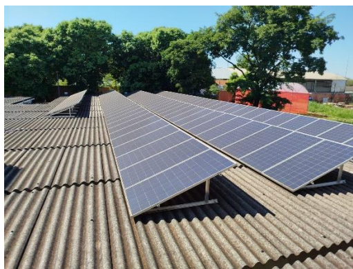
Painéis solares instalados no telhado da UPEQ.