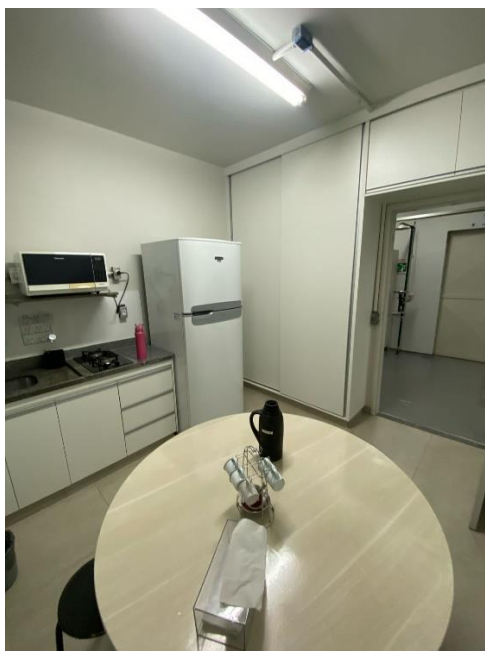
Sala de convivência reformada - 1K 112.

Ainda no Bloco 1K , foi realizada a troca das tubulações antigas de ferro por canos de PVC (Processo nº 23117.065271/2023-01), um problema antigo que danificava equipamentos dos laboratórios didáticos e de pesquisa e que fazia com que os filtros dos bebedouros de água saturassem rapidamente. E, nas salas dos docentes , trocou-se, a medida do possível, o mobiliário (mesas, armários e cadeiras) e computadores .