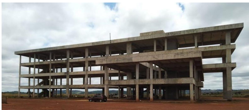
Início das obras do campus da UFU em Patos de Minas, ano de 2020.