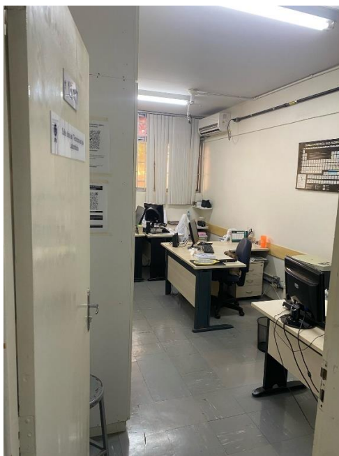
Sala das técnicas de laboratório - 1K 117.

No ano de 2020 , foi necessário trocar as calhas de todo o telhado do Bloco 1K , uma vez que as mesmas haviam sido construídas sem quedas e estavam oxidadas com vazamentos em alguns locais desse prédio.