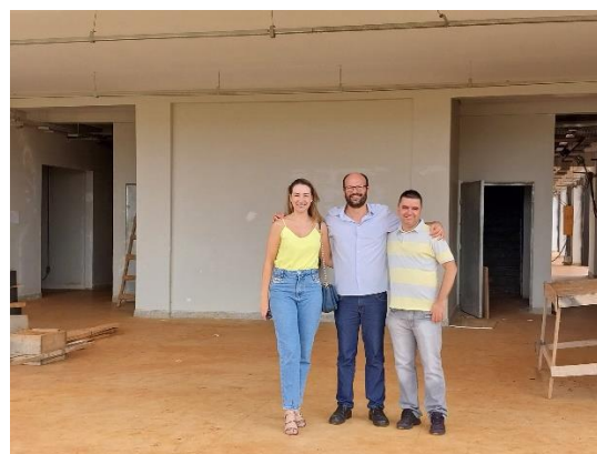
Visita realizada em 2024 nas obras do campus da UFU em Patos de Minas.

Em Patos de Minas , a UFU oferece três cursos de graduação : Engenharia Eletrônica e de Telecomunicações (FEELT), Engenharia de Alimentos (FEQUI) e Biotecnologia (IBTEC). Além disso, a universidade conta com dois cursos de mestrado, nas áreas de Biotecnologia (PPGBIOTEC) e Engenharia de Alimentos (PPGEA) .