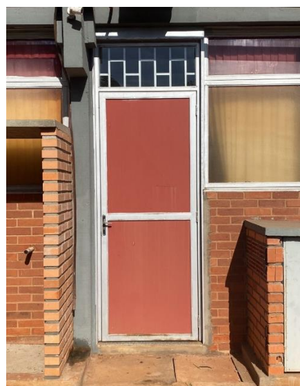
Instalação de porta externa no laboratório didático 1.

Outra demanda atendida em 2018, foi a de se criar uma sala para as técnicas de laboratório , um local em condição salubre para cumprimento da jornada de trabalho , nos períodos em que elas não estivessem preparando ou acompanhando as aulas . O diretor providenciou a sala 1K 117 , isenta de produtos químicos e ruídos, com boa iluminação, aparelho de ar condicionado e mobiliário adequado (Processo nº 23117.039351/2018-36).